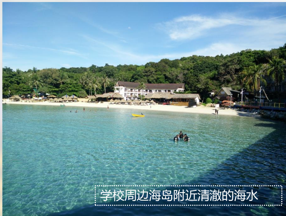
学校周边海岛附近清澈的海水