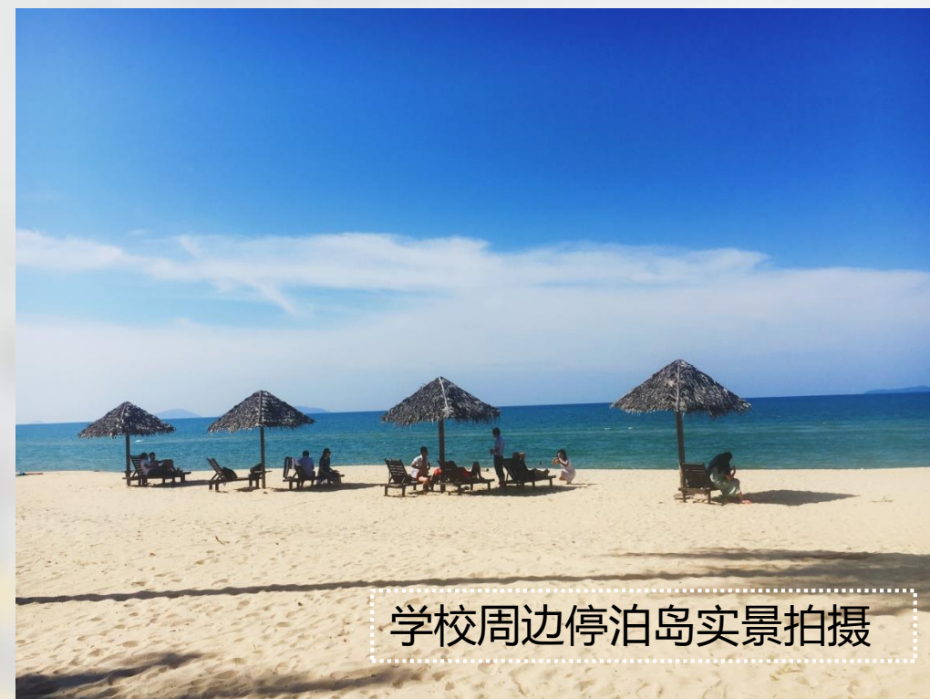
学校周边停泊岛实景拍摄