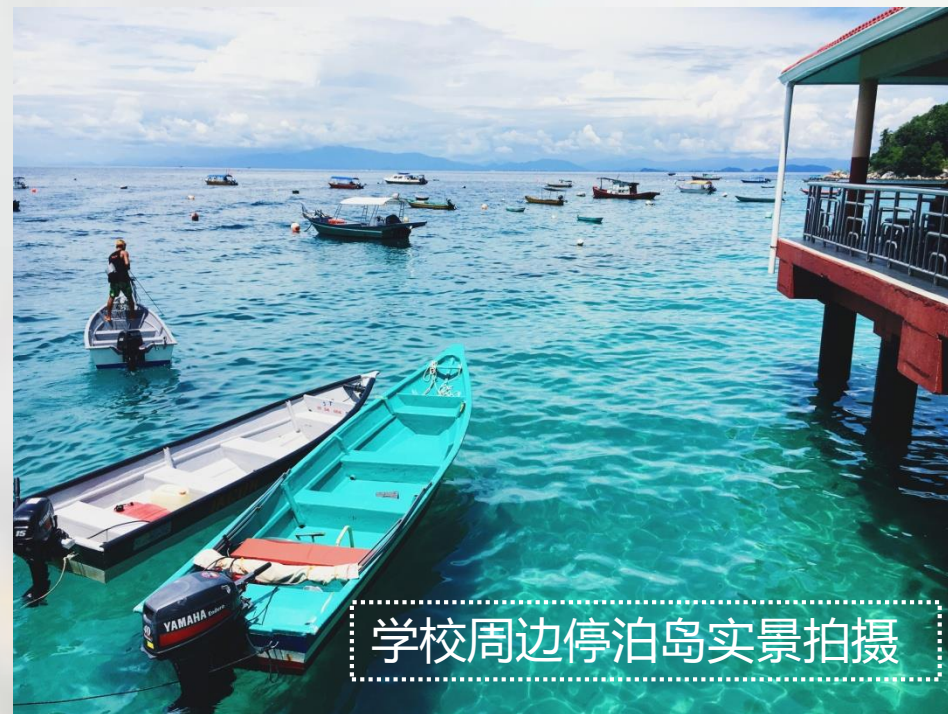
学校周边停泊岛实景拍摄

材料准备说明：1、公证材料、从业证明、银行存款证明为中英文材料 2、proposal(开题)材料需要英文 3、申请表可以中文填写