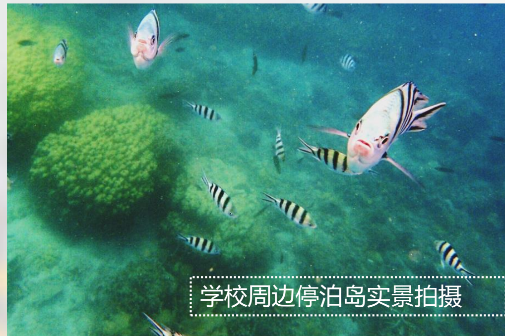
学校周边停泊岛实景拍摄

注： 大学一共提供有100多专业及308个研究方向，更为详细的请浏览院系及专业材料