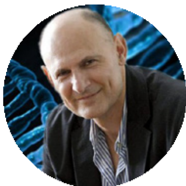
Juan Carlos Izpisua

武康大学是一所钟灵毓秀的学府，人才辈出，不论是工商界还是医疗界、体育界，都有出类拔萃的人才，无论是国际校友还是本土校友都将是每一位武康学子的宝贵资源。